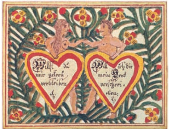
Liebesbrief, 1822 Johann Mägli-Günter