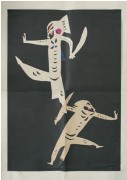
Opernszene Zhu Xinjian Nanjing, China