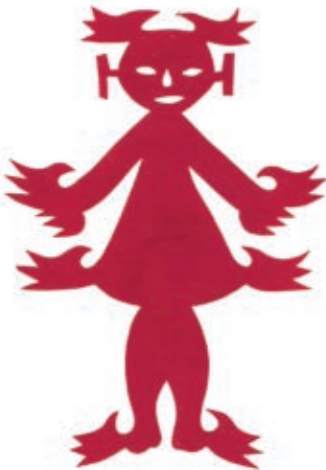
Glückbringendes Kind mit Vögeln Provinz Shaanxi, China