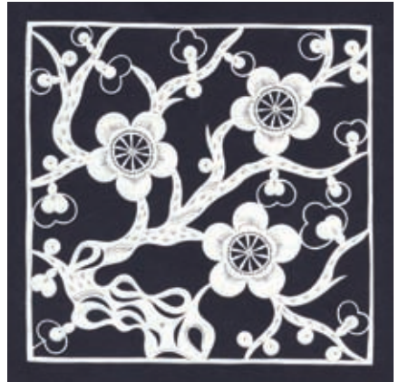
Winterpflaumenblüten Provinz Hebei, China