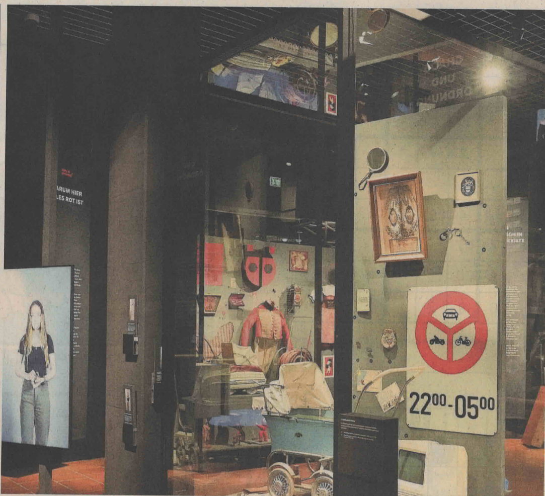
Bei der neuen Ausstellung steht die eigene Museumssammlung im Zentrum.

Am Donnerstag, 16. November, um 16.30 Uhr an der Baarerstrasse 110A in Zug: Themen: Erbrecht, Nachlassplanung, Vorsorgeauftrag, Vollmacht, Demenz im Recht und mehr. Infos: 0417109350 oder www.anwaeltin-zug.ch