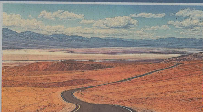
Am 16. November gibt es Informationen zum selbstbestimmten Sterben.

Der Anlass findet am Freitag, 17. November, ab 18.30 Uhr im Restaurant Höllgrotten in Baar statt.