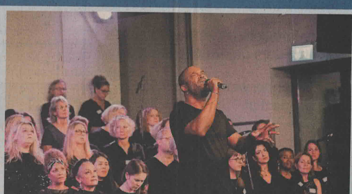
Die Teilnehmenden bilden einen grossen Gospelchor.